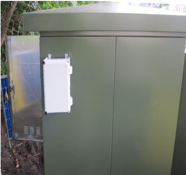
Afbeelding pulskast van Fluvius