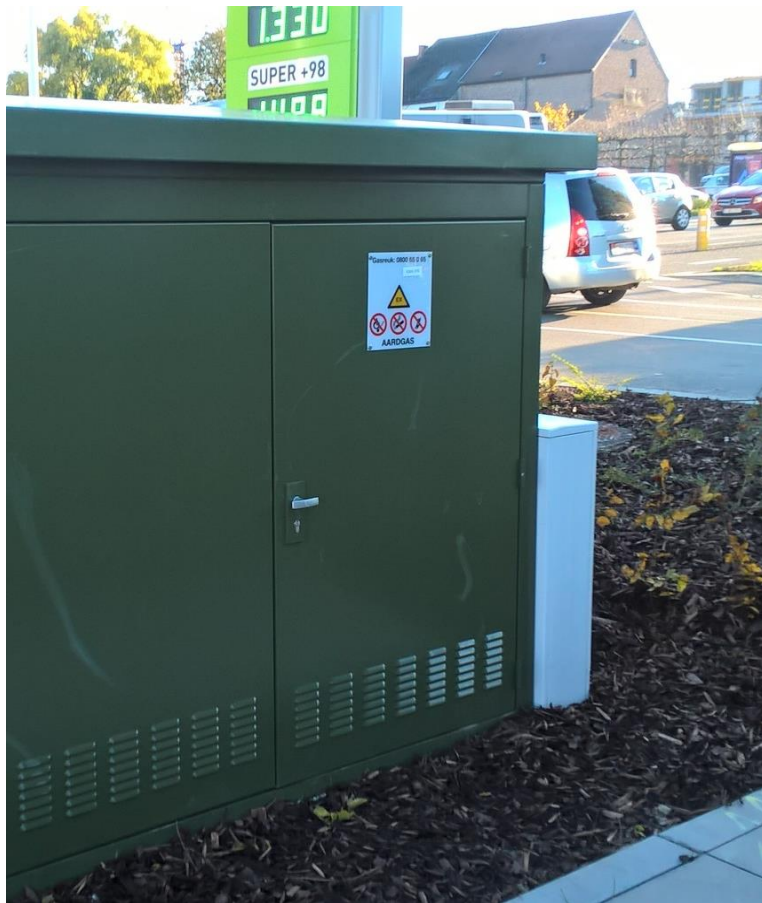
Afbeelding tele-opnamekast van Eandis (rechts van gascabine)